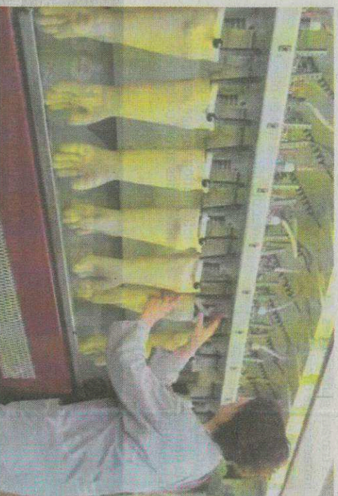
Si l'industrie tarde encore à retrouver son niveau d'avant la crise sanitaire, l'emploi salarié connaît globalement une progression soutenue dans la région.

Le nombre de salariés augmente dans tous les départements du Centre-Val de Loire (sauf dans l'indre où il est pour l'instant stable). La plus forte pro-