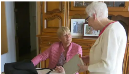
Romorantin : la médiathèque apporte le livre à domicile