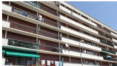
Indre-et-Loire : difficile de supporter la canicule "à six dans un appartement"