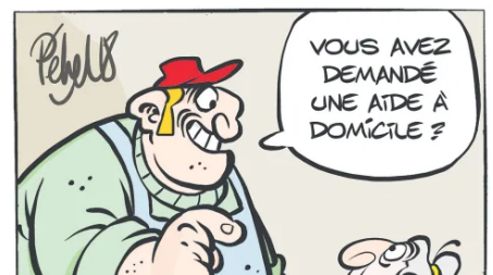
C'est une aide à domicile pas un ouvrier d'entretien