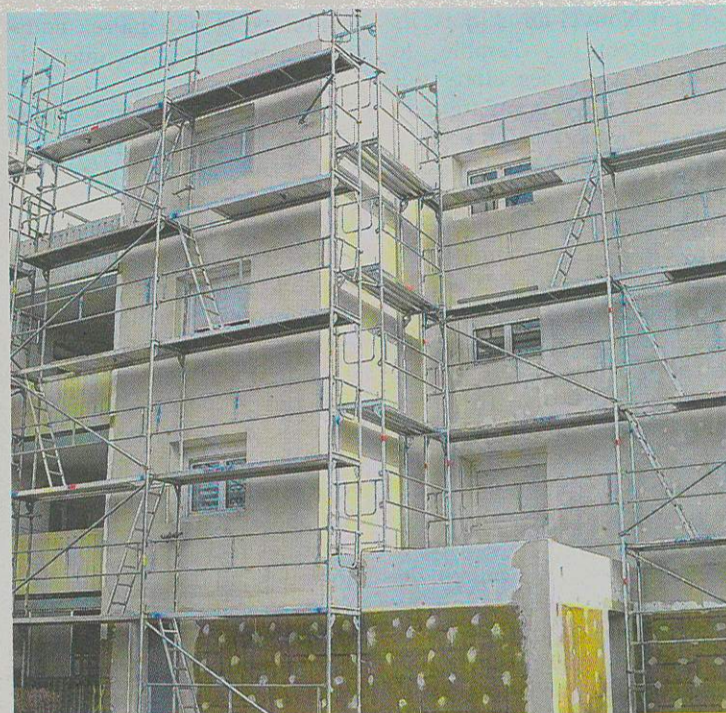
En 2019, Val Touraine Habitat a rénové un millier de logements et a livré 302 logements neufs.

solide et bien structurée » qui entend rester « un outil d'aménagement majeur » pour le département (lire repères). Pour Val Touraine Habitat, l'année 2020 sera celle d'un nouveau « projet d'entreprise » et d'une profonde réorganisation. « Une transformation en profondeur est nécessaire et indispensable pour s'adapter à nos nouvelles compétences et nos nouvelles activités », explique Jean-Luc Triollet en visant de nouveaux marchés immobiliers en concurrence avec des promoteurs privés. Déjà, VTH a décroché avec succès un grand projet d'habitat à Saint-Cyr-sur-Loire et celui de la Zac des Dolbeaux à Semblançay. D'autres devraient suivre.